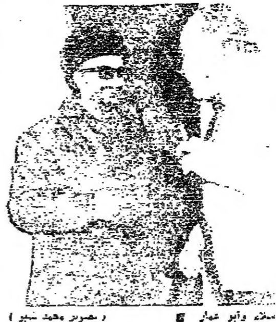
الرئيس عبد الرحمن أبو عياد

زار السيد ناصر عرفات ورئيس منظمة التحرير الفلسطينية السيد الرئيس صائب سلام في منزله بالمصيصة واستمر اجتماعهما ساعة ونصف الساعة.